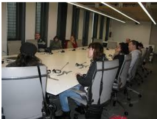
ALUMNOS DE CEPA HERNANI EN JUNTAS GENERALES DE GUIPUZCOA

Estimular el respeto por las normas generales de convivencia utilizando el diálogo como instrumento para la resolución de conflictos