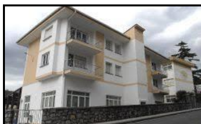
EPA Andoain HHI Kale Nagusia, 4B C.P. 2014

La proximidad de otros centros de Educación Permanente de Adultos de mayores dimensiones (Donostia- San Sebastián, Lasarte-Oria...) puede influir en su tamaño, ya que se trata de un centro con una plantilla de 11 profesores y una orientadora a media jornada (curso 2018/19). Como consecuencia, la oferta educativa se centra en la Enseñanza Reglada. Cuenta con aproximadamente unos alumnos/as 200 en el curso 2018/19, distribuidos en distintos grupos de Grados I-II y III en horario de mañana y tarde, además de algunos grupos de Enseñanza No Reglada.